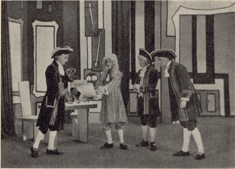
«Der Bürger als Edelmann»

Monsieur Jourdain erhält die Urkunde, die ihn zum Baron ernennt